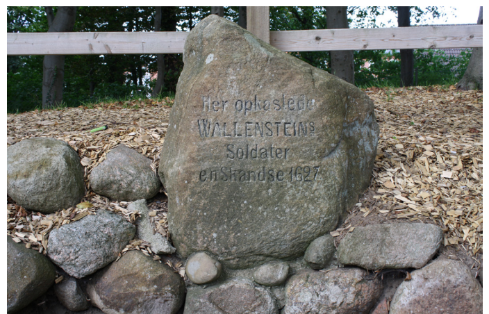
"Her opkastede Wallensteins soldater en skandse i 1627"