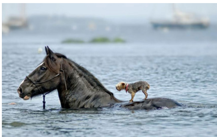
Værdien af samarbejde