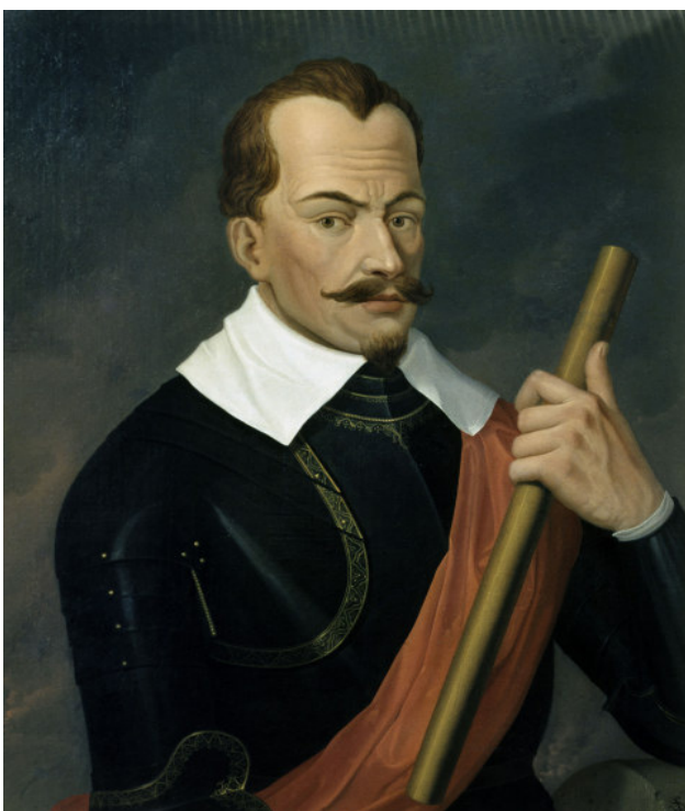
Albrecht von Wallenstein

Udover stenen ved Skansen i Varde, forefindes i Hanne Kirke et portræt af general Piccolomini, en officer i Wallensteins besættelsesstyrker og hjernen bag mordet på Wallenstein i 1634. Portrættet blev malet under Piccolomini's kantonnement på Hennegård.